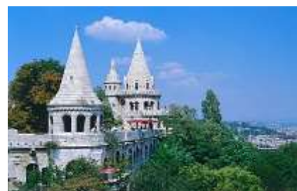
Bastión de los Pescadores