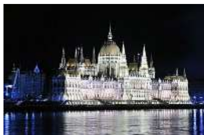
El Parlamento iluminado