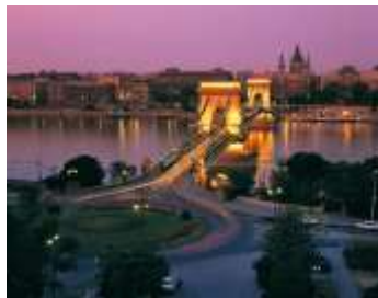
Puente de las Cadenas

Desayuno. Por la mañana visita panorámica de Budapest (Empezando por la plaza de los Héroes, admirando los diferentes estilos del casillo de Vajdahunyad, seguiremos la visita pasando por los palacios de la avenida Andrásy, la Basílica, el Parlamento; a la orilla de Buda llegaremos pasando por el puente Margarita, echando un vistazo sobre la elegante isla con el mismo nombre. En la calle principal veremos un baño turco, y varios monumentos importantes de diferentes épocas. En el barrio medieval de Buda entramos a la iglesia Matías, subimos al Bastión de Pescadores, y en el tiempo libre podemos disfrutar del ambiente único de este barrio. Finalizamos la visita después de haber pasado por la Ciudadela (mejor lugar en la ciudad para sacar una foto). Almuerzo en el centro.