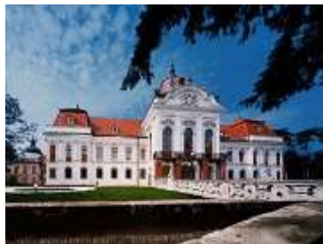
Gödöllő – Palacio de Sissi

Desayuno. Salida hacia Gödöllő. Visita del palacio de verano de la emperatriz Sissi, donde veremos en que entorno pasó ella los días más felices de su vida. Seguimos hacia el noreste del país, para visitar Hollókő, pequeño pueblo, con auténticas casas campesinas; este pueblo fue declarado como parte del patrimonio de la humanidad. El almuerzo será en casas de la gente local de Hollókő, una experiencia única! Probarémos lo típico del pueblo "palóc", famoso además de su dialecto, por su comida Por la noche llegaremos a Eger, donde después de haber ocupado el hotel asistiremos a una degustación de vinos que estará acompañada por una rica cena en el típico barrio de bodegas de la ciudad más famosa de sus vinos tintos en Hungría.