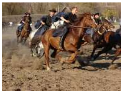
Espectáculo ecuestre en la Puszta