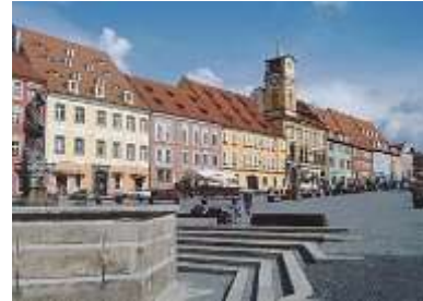
La ciudad barroca de Eger