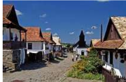
El pueblo de Hollókő