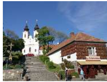
Tihany – detrás la Abadía