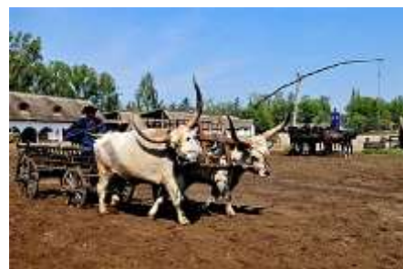
La finca en la Gran Llanura