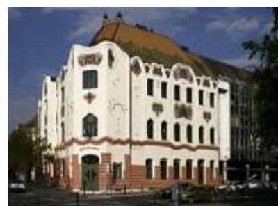
Kecskemét – Palacio Cifra