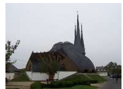
Iglesia de Makovecz en Pécs