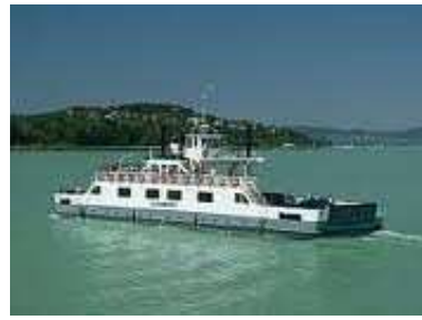
Ferry en el lago Balaton