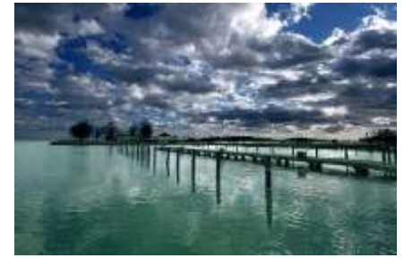
Puerto de Balatonfüred