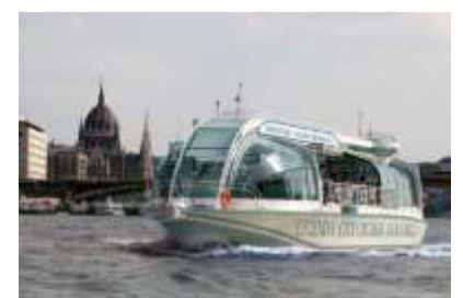
Paseo en barco por el Danubio