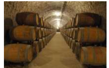
Bodegas en Eger